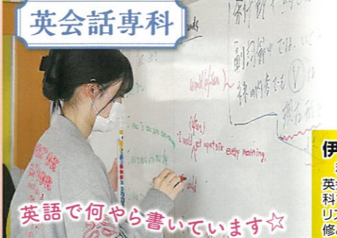
英語で何やら書いています☆

私は英語が好きで将来国際系の仕事につきたいと思い、英会話専科で一年英語を勉強することにしました。英会話専科では一日のほぼ全ての授業を英語ですすめていくため、リスニング力が上がった気がします。来年の2月には海外研修としてイギリスのロンドンへ行くのでとても楽しみです。